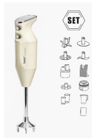
Drei Bamix BAKING CHF 439