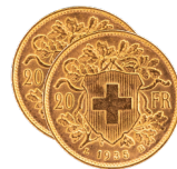
Zwei Geldvreneli je CHF 404