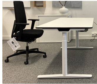
Arbeitsstisch Rondo elektrisch HV; 16000 / 800 mm Verstellbar 65 - 128 cm; CHF 1'544