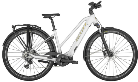
SCOTT- E-Bike City Sub Sport; CHF 3'799