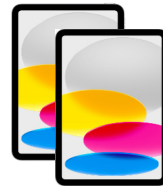
Zwei iPad 2022 (10. Gen) 1x CHF 668 & 1x CHF 378