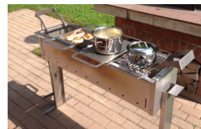
Letrona - Spiessgrill mit Zubehör CHF 670