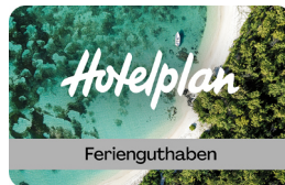
Feriengutschein 1 x CHF 500 & 1x CHF 250